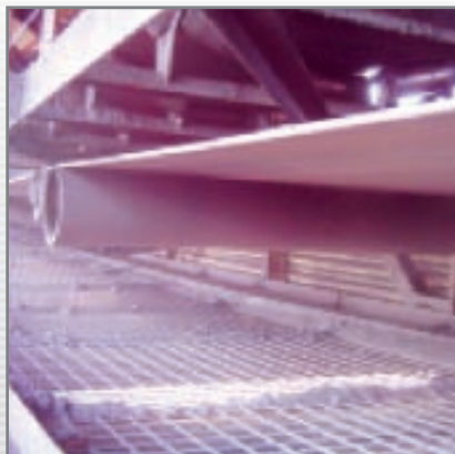
Il rullo “Belt Tracking” Rulmecca previene i danni del nastro