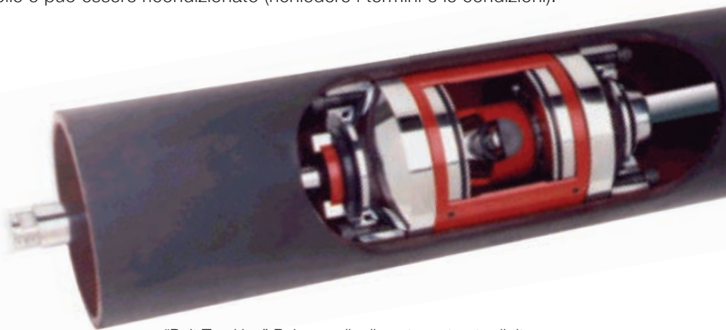
“Belt Tracking” Rulmecca, il rullo autocentrante di ritorno

Il rullo “Belt Tracking” Rulmecca è garantito per 2 anni . È completamente manutenibile e può essere ricondizionato (richiedere i termini e le condizioni).