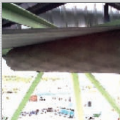
Il rullo “Belt Tracking” in azione